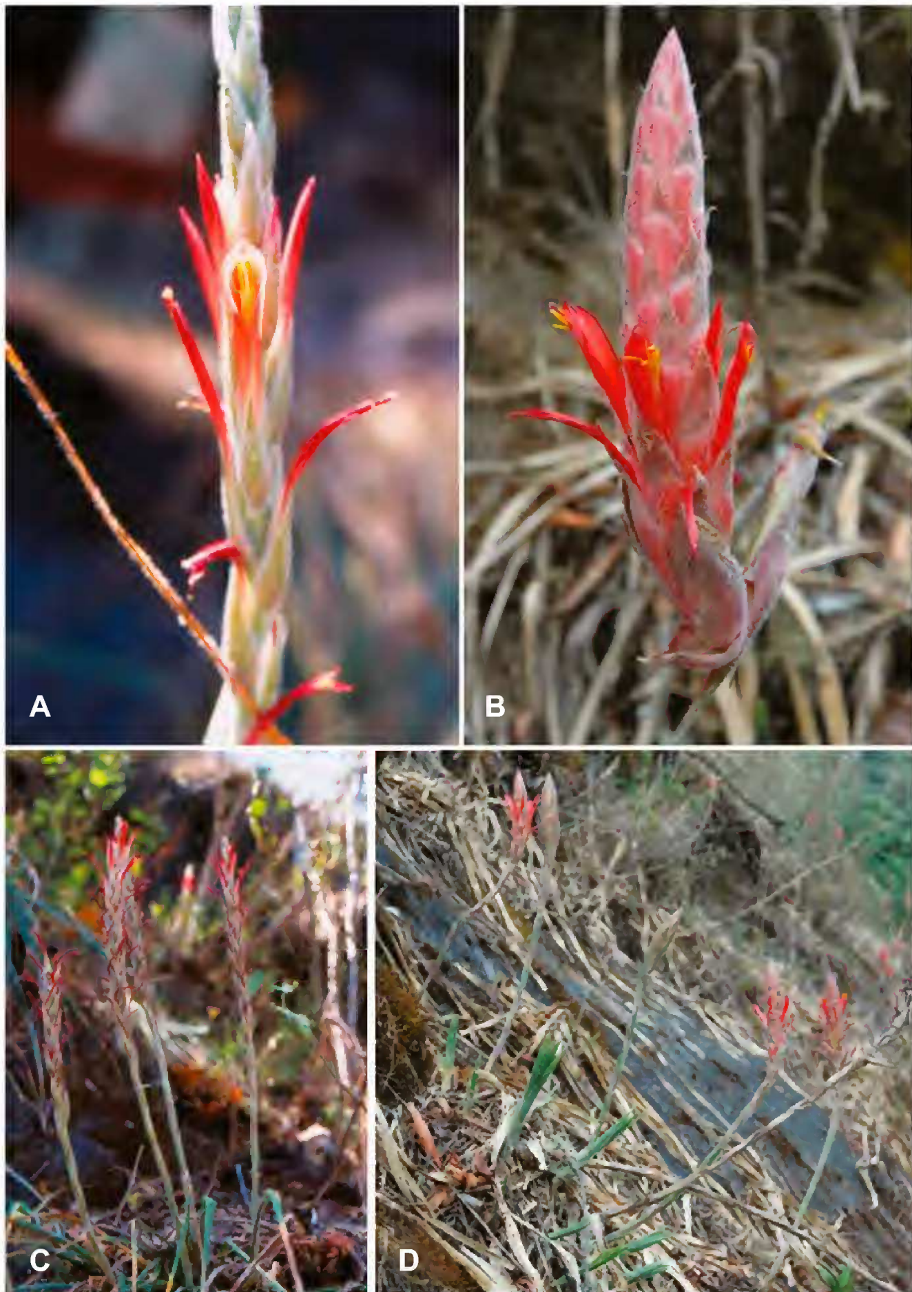
Fig. 1. A y C. Pitcairnia roseana L.B. Sm. (A. R. López-Ferrari et al. 2404). B y D. P. yocupitziae Espejo & López-Ferrari ( Y. Ramírez-Amezcuca et al. 969).